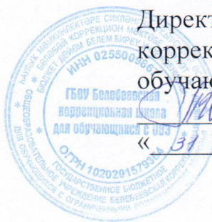
График движения автобуса ПАЗ 32053-70 госномер Н 333 НС ГБОУ Белебеевская коррекционная школа для обучающихся с ОВЗ по маршруту № 1

«ГБОУ Белебеевская коррекционная школа для обучающихся с ОВЗ – р. п. Приютово – по городу – ГБОУ Белебеевская коррекционная школа для обучающихся с ОВЗ» на 2018-2019 учебный год